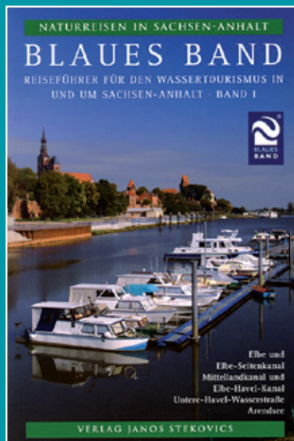
Broschüre Blaues Band, Reiseführer für den Wassertourismus

nicht an politischen Grenzen zu orientieren, sondern länderübergreifende und grenzübergreifende Kooperationen im Marketing zu stärken. Dem Gast müssen themenspezifische und gebündelte Informationen an die Hand gegeben und in einem zeitgemäßen Outfit präsentiert werden. Die bereits vorhandene, attraktive Infrastruktur ist zu sichern und – wo nötig – durch Lückenschlüsse zu komplettieren. Insbesondere vor dem Hintergrund von Wasserstandsschwankungen sind Anpassungen erforderlich.