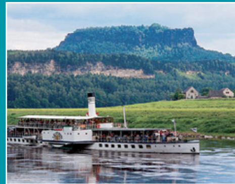
Schauflerraddampfer „PD Leipzig“

Von grundlegender Wichtigkeit für die südböhmische Region war es, eine synergetische Lösung zu finden, die das Gebiet wirksamer vor Hochwasser schützt und es zugleich attraktiver für den Wassertourismus macht. Ein gelungenes Beispiel ist das Hochwasserschutzprojekt an dem größten böhmischen Teich, dem Rosenberg-Weihers. Die geplanten Veränderungen des Damms ermöglichen es, auch Hochwasser auf dem Niveau Q 100 einzudämmen. Grundlage für die Wahl dieser Lösung waren Gebietsstudien, in denen detaillierte Entwicklungsstrategien für besiedelte und unbesiedelte Gebiete vorgelegt und die Folgen eventueller Entwicklungsprojekte für die Regionen – einschließlich möglicher Auswirkungen auf den Hochwasserschutz – genauestens analysiert werden. Ein weiteres Beispiel für eine den Tourismus und Hochwasserschutz verbindende Lösung ist der Entwurf zum Bau des Schutzhafens České Vrbné, der sich unweit vom Nordrand des Zentrums von Budweis am Oberlauf der Moldau befindet. Der Bau des Schutzhafens ist ein klares Signal an die Besitzer von Ausflugs- und Touristenschiffen, das besagt: wir kümmern uns um Eure Schiffe – auch in Hochwasserzeiten. Aus diesen Studien und Analysen lassen sich bezüglich des Potenzials