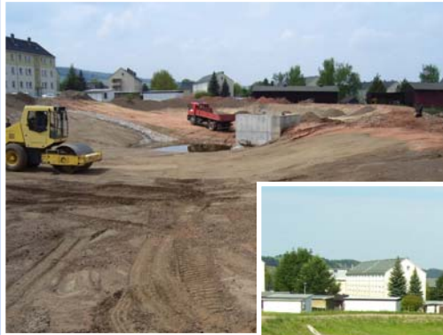
RÜB im Bereich der Brauerei