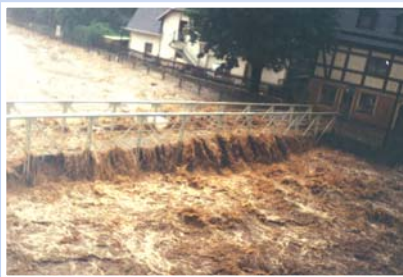
B R Ü C K E A M S T E G