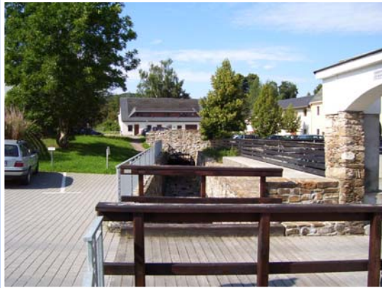
Rungstockbach nach Offenlegung