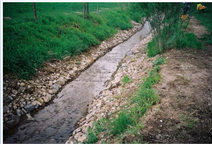
Reukersdorfer Bach nach Offenlegung