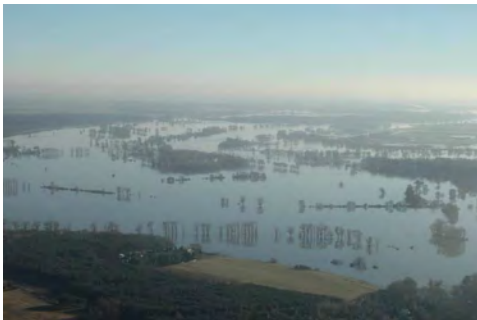
Elbe oberhalb des Pretziener Wehres (LK Salzlandkreis)