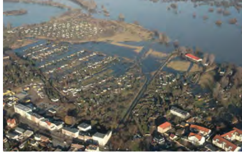
Neue Sülzemündung in die Elbe im Bereich Salbke/Magdeburg; überschwemmtes Kleingartengebiet