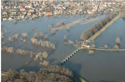
Pretziener Wehr, Januar 2011

Holger Platz – Einführung in den Workshop