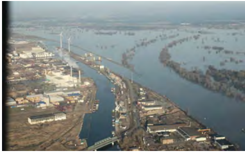
Elbe/Zweigkanal mit Baustelle der neuen Schleuse (die Elbe ist der Bereich zwischen den Baumreihen)