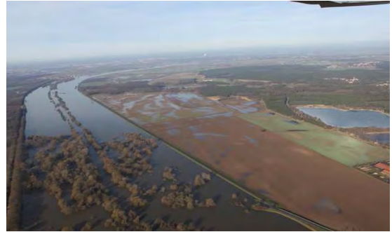
Elbumflutkanal Januar 2011

Holger Platz – Einführung in den Workshop